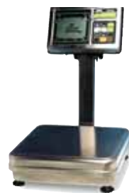
Modelo: FS Series Fácil de leer y rápida de lectura 6kg / 2g – 30kg / 10g