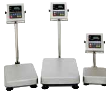
Modelo: HV-WP / HW-WP Series Balanza de Triple Rango / Alta Resolución HV-WP: 3kg / 1g – 220kg / 100g HW-WP: 10kg / 1g – 220kg / 20g